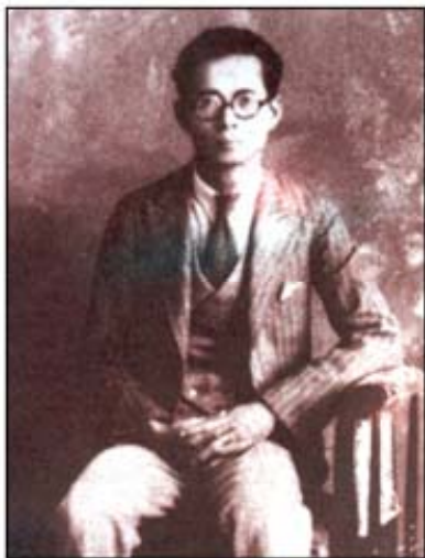
鄧雨賢是台灣第一位被塑立銅像的音樂家